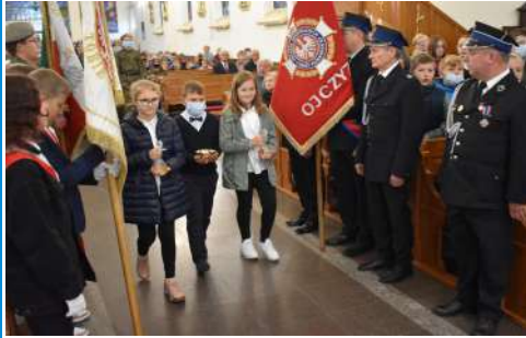
Obchody 82. rocznicy Obrony Łaskarzewa 17 września 2021 r.