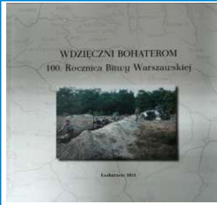
Publikacja z okazji 100. Rocznicy Bitwy Warszawskiej

W ramach obchodów 100. Rocznicy Bitwy Warszawskiej 1920 r. wydany został Album "Wdzięczni Bohaterom". Zawiera on biogramy osób związanych z Łaskarzewem, które brały udział w walkach 1920 r., relację z rekonstrukcji historycznej w Łaskarzewie oraz odsłonięcia tablicy upamiętniającej to wydarzenie w sierpniu 2020 r.