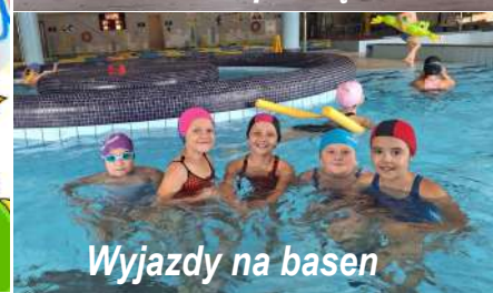
Wyjazdy na basen