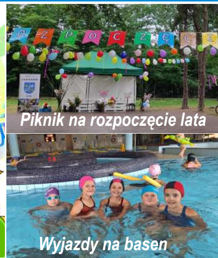
Piknik na rozpoczęcie lata