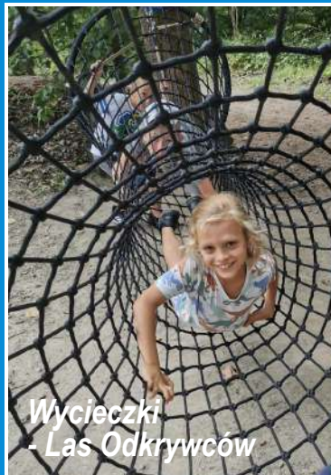
Wycieczki - Las Odkrywców