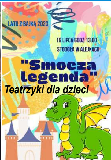
LATO Z BAJKĄ 2023 19 LIPCA GODZ. 13.00 STODOŁA W ALEJKACH "Smocza legenda" Teatrzyki dla dzieci