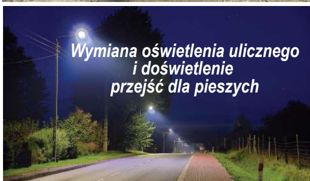
Wymiana oświetlenia ulicznego i doświetlenie przejść dla pieszych