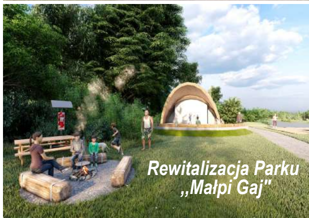
Rewitalizacja Parku „Małpi Gaj”