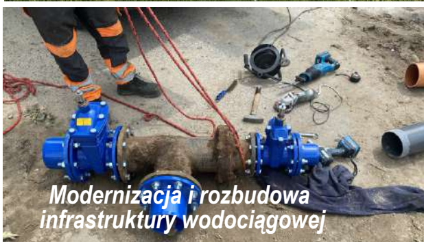
Modernizacja i rozbudowa infrastruktury wodociągowej