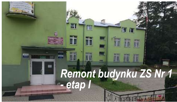
Remont budynku ZS Nr 1 - etap I