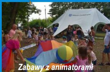
Zabawy z animatorami