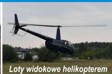
Loty widokowe helikopterem